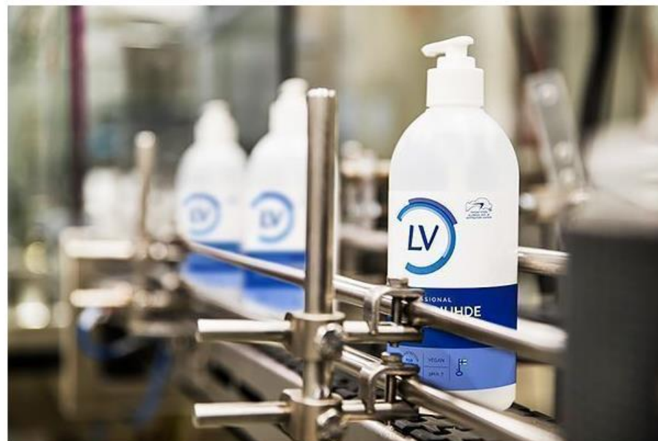
Kuva. Käsihuuhteen valmistuslinja Heinäveden tehtaalla.

Monialayhtiö Berner teetti materiaalikatselemuksen yhdellä kolmesta Heinävedellä sijaitsevassa tehtaassaan. Katselemuksen esiin tuomilla parannustoimilla on saavutettu jo yli 30 000 kilon raaka-ainesäästöt ja jätemäärät ovat pienentyneet yli 25 000 kiloa. Tämä tarkoittaa myös luonnonvarojen säästymistä ja yli 100 000 euron rahallisia säästöjä.